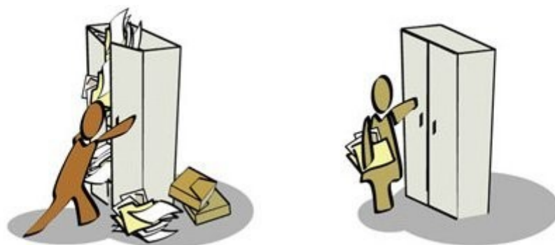
La mission de conservation

La notion d'archives est indissociablement liée à la notion de conservation. Il en résulte que la conservation des documents d'archives est l'une des missions fondamentales de l'archiviste . En l'accomplissant au mieux, il assure la transmission du patrimoine archivistique aux générations futures et garantit que ce patrimoine demeurera accessible.