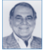
Yvo PITANGUY, Rio de Janeiro, Brésil