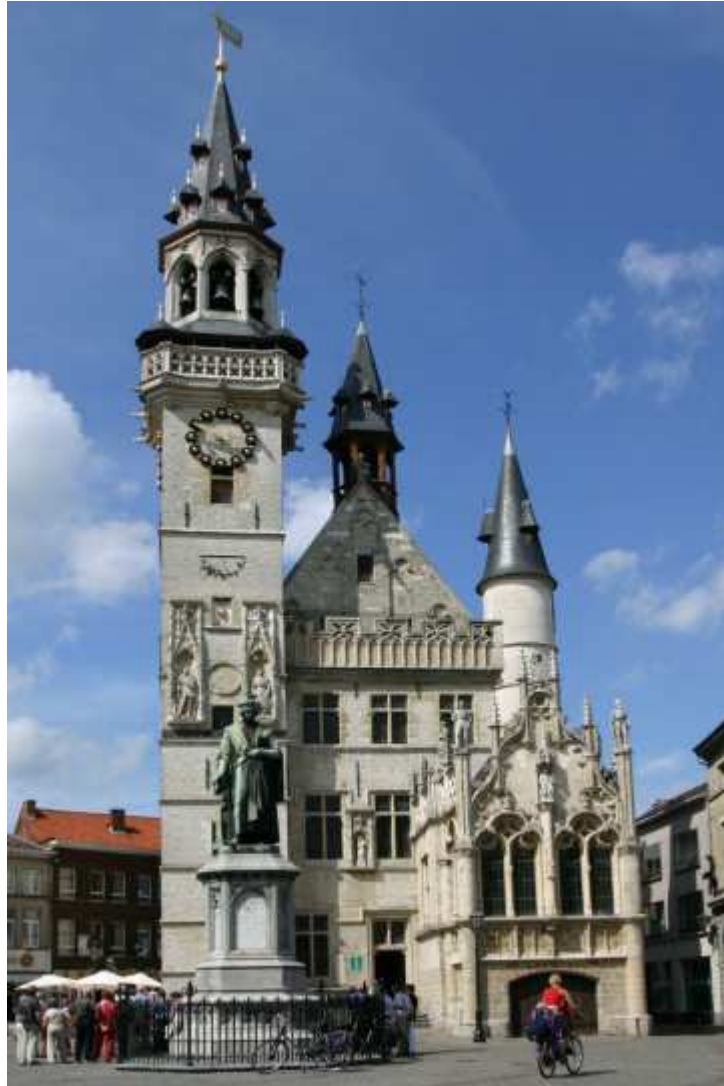
Ci-dessus, le beffroi d'Alost en Belgique.

À l'intérieur de la ville il y a trois changements extrêmement importants qui vont marquer l'époque :